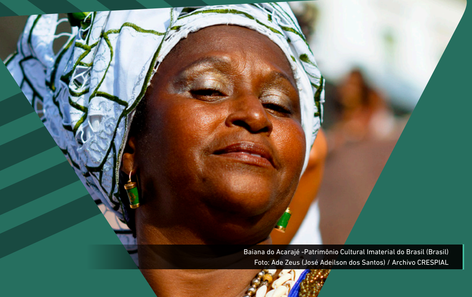
Baiana do Acarajé - Patrimônio Cultural Imaterial do Brasil (Brasil)