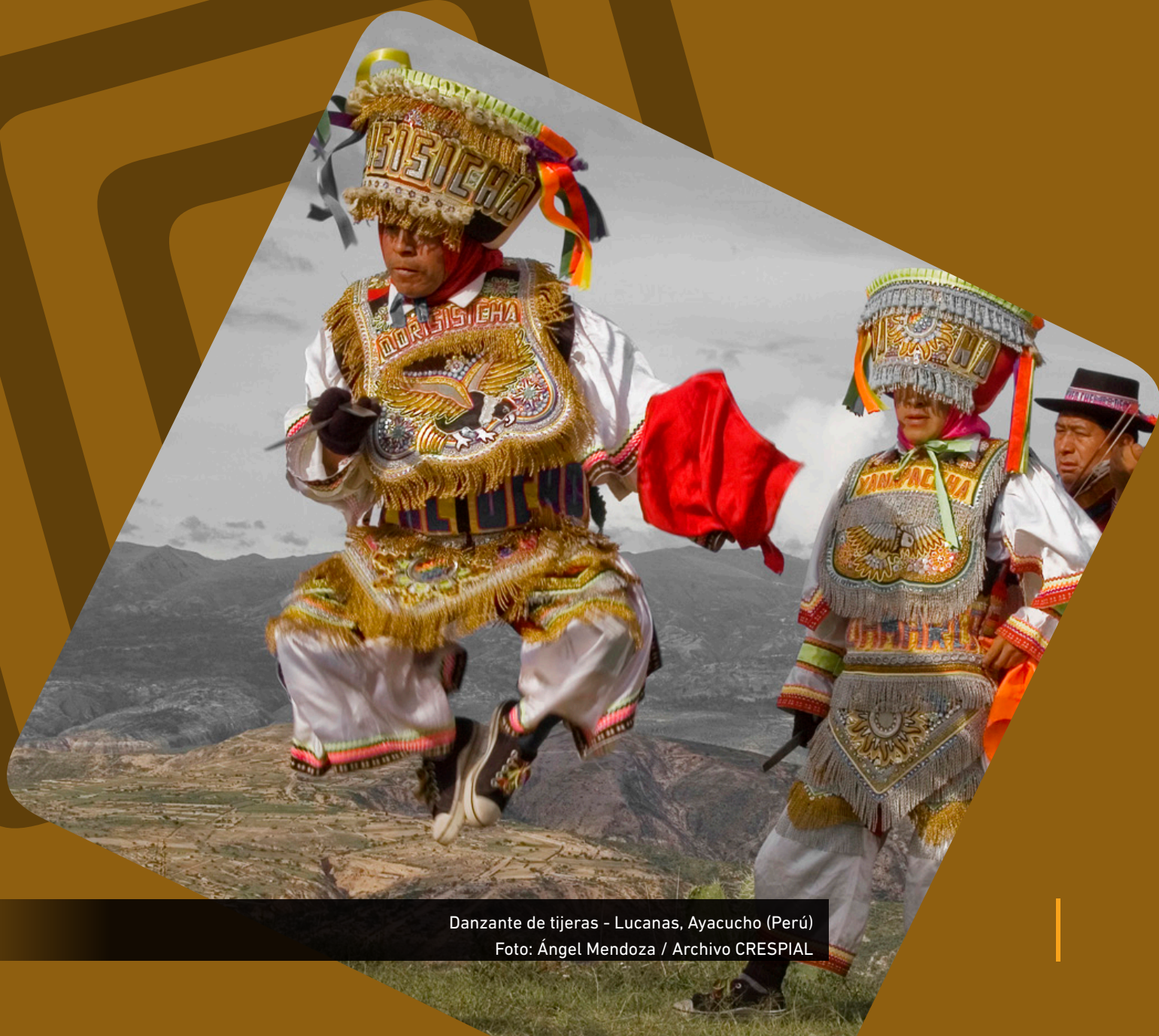
Danzante de tijeras - Lucanas, Ayacucho (Perú)