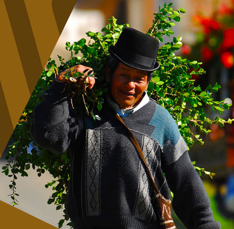
Indígenas Guambianos celebran la Semana Santa (Colombia)