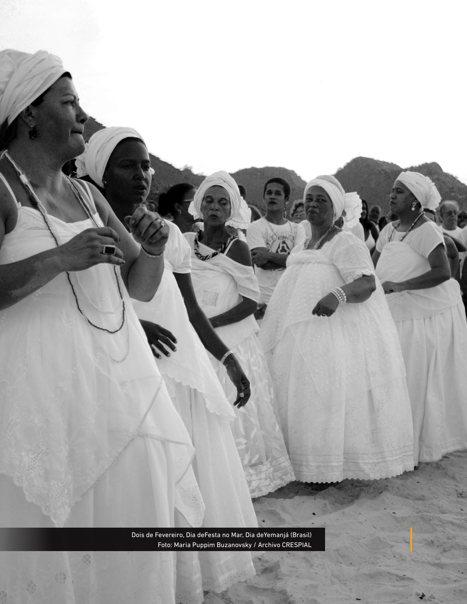
Dois de Fevereiro, Dia de Festa no Mar, Dia de Yemanjá (Brasil)