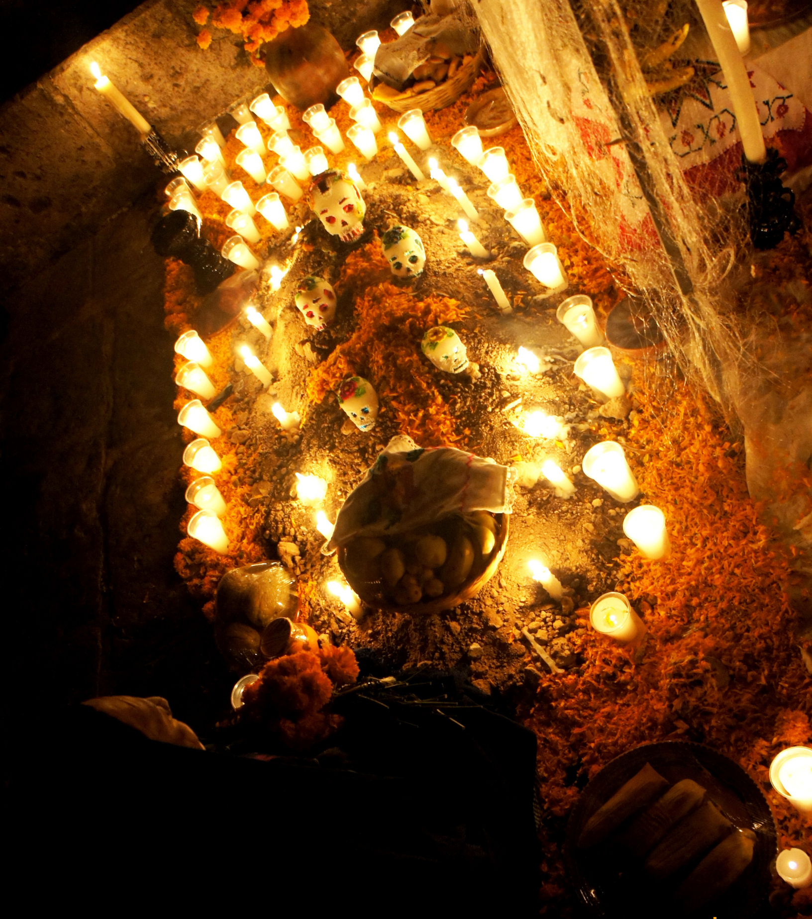
Celebrando y recordando a los muertos en Mérida y Morelia (México)