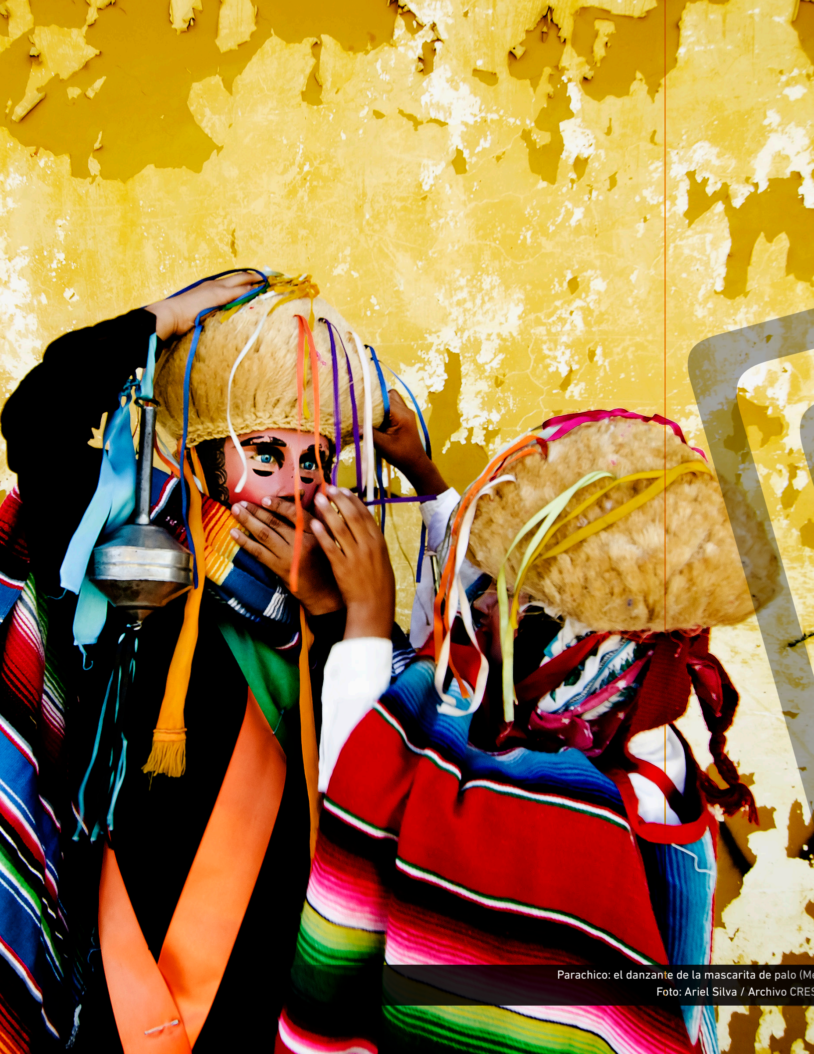
Parachico: el danzante de la mascarita de palo (Me