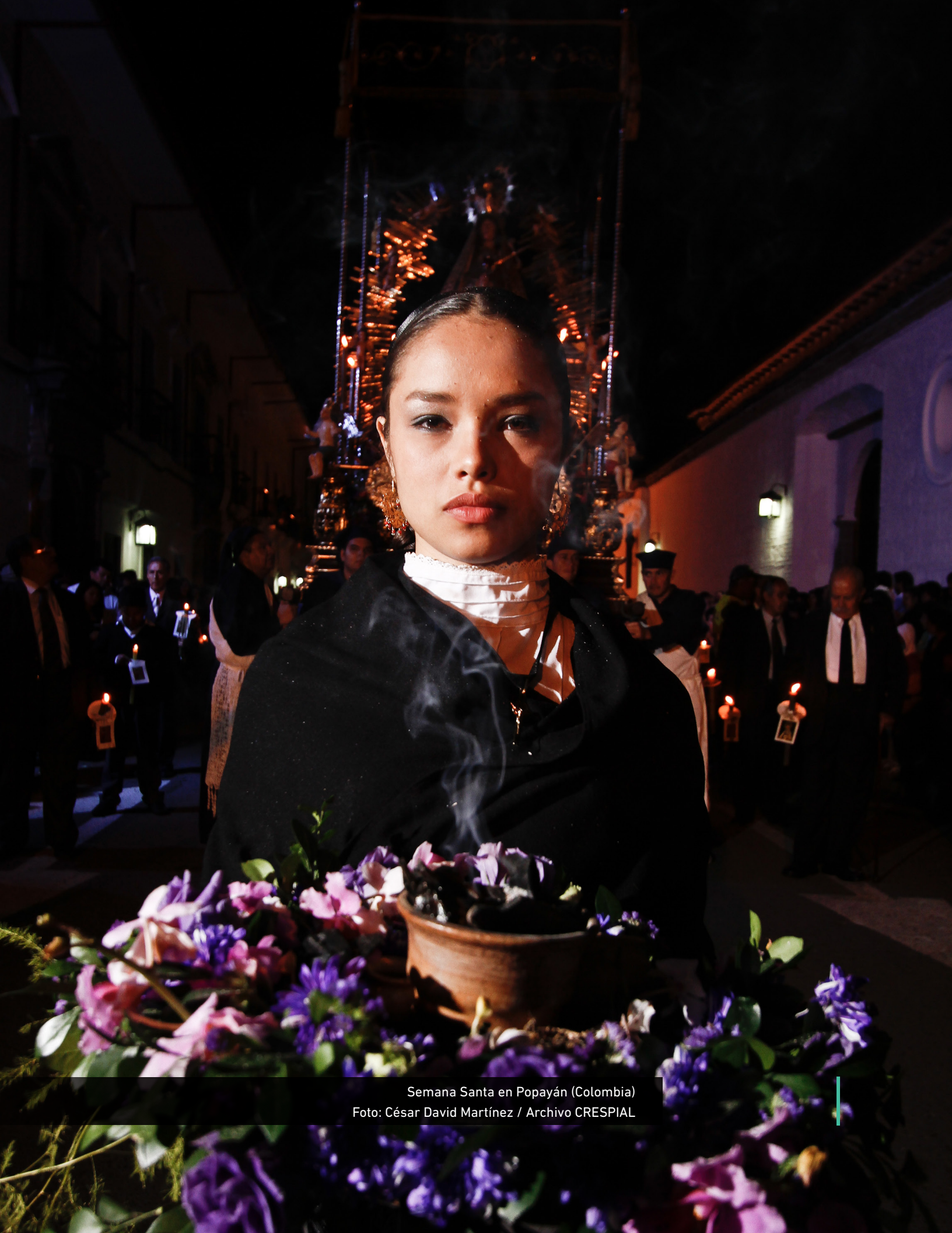
Semana Santa en Popayán (Colombia)