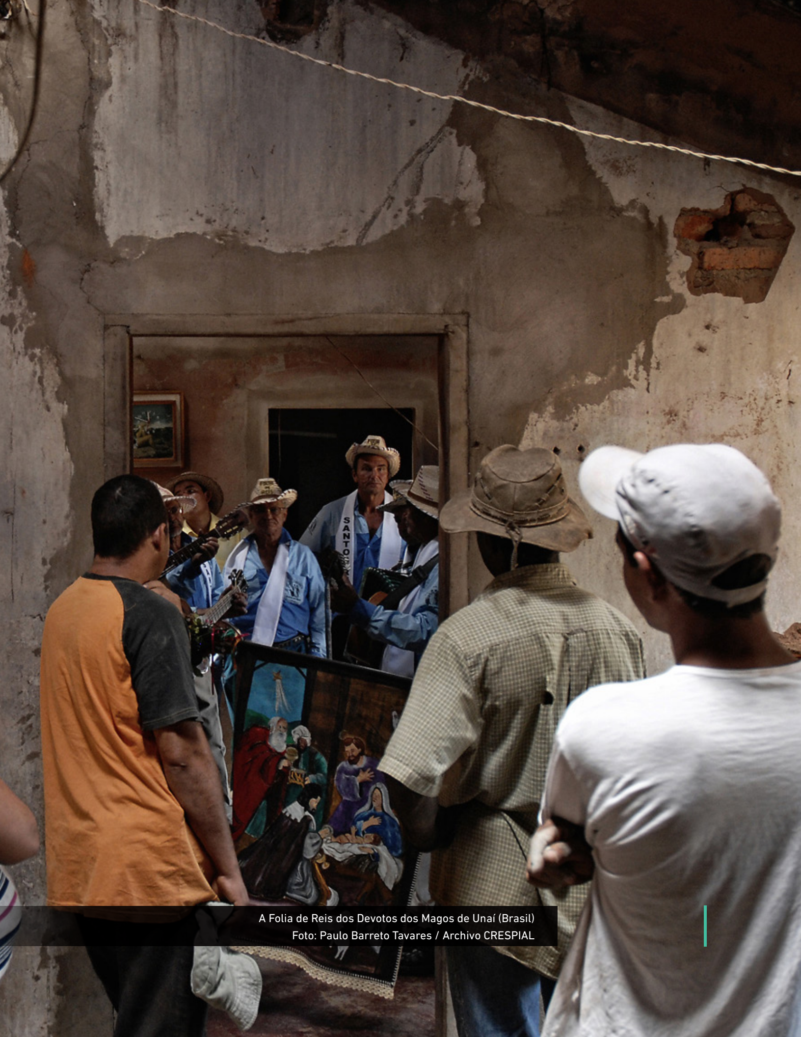
A Folia de Reis dos Devotos dos Magos de Unai (Brasil)